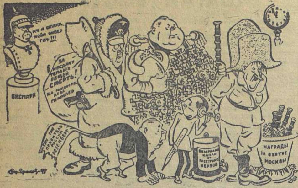
Новогодний парад в Берлине